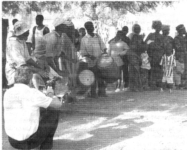
I Vigili del Fuoco girano un documentario in Mali