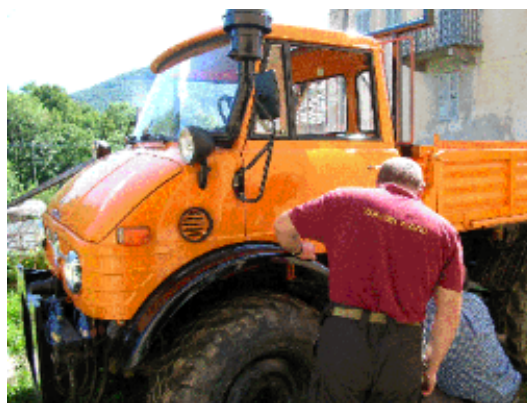
Il veicolo antincendi da acquistare

Il ricavato del concerto verrà interamente utilizzato per l'acquisto del veicolo antincendio per la Comunità di Oualia.