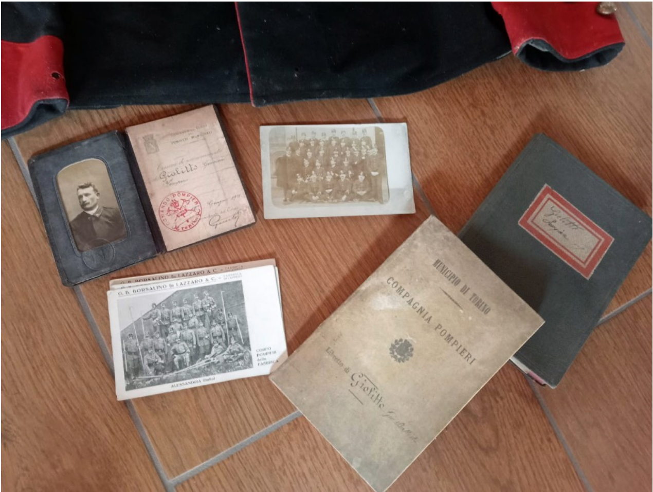
Insieme delle fotografie e dei documenti di G.B. Giolitto