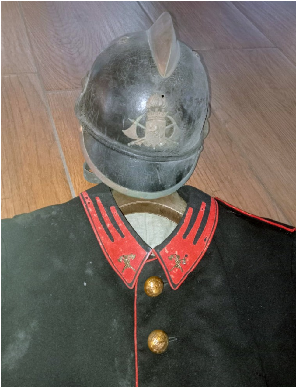
L'elmo con il fregio dei Civici Pompieri di Torino e un particolare della giacca con i fregi e i bottoni