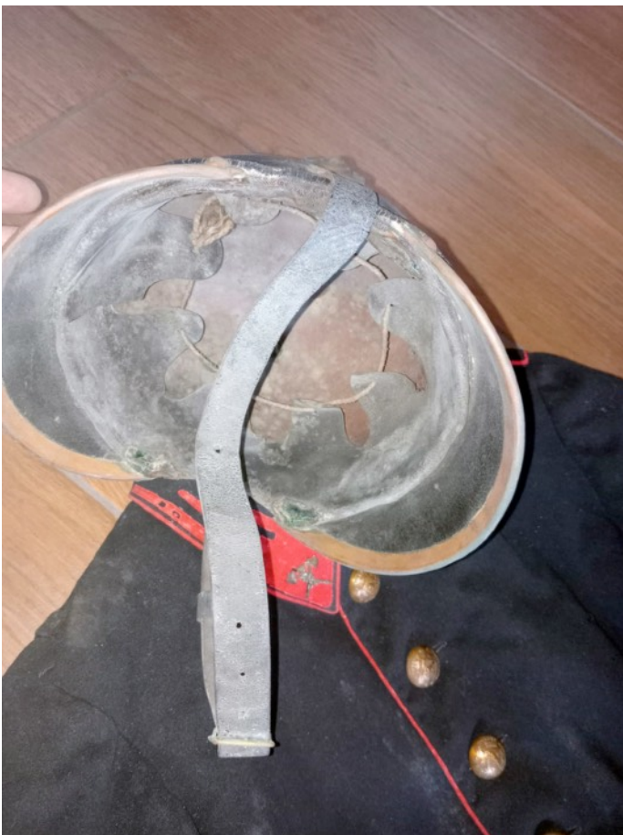
L'interno dell'elmo e un dettaglio della divisa